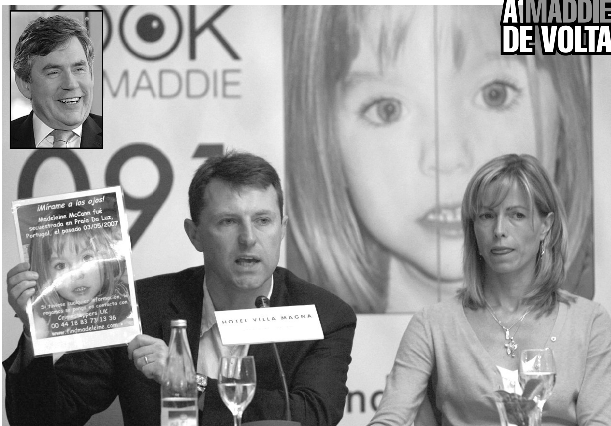
Gordon Brown (foto pequena) fez questão de puxar o assunto do momento, o desaparecimento da menina inglesa

Texto • Luís Fontes luís.fontes@24horas.com.pt